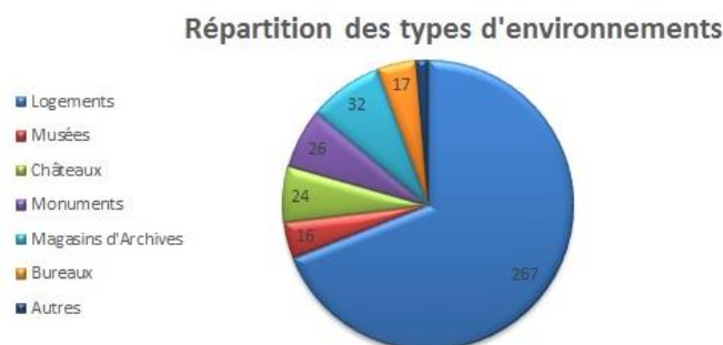
Figure 1 : Distribution des différents types d'environnements ayant servi à la validation de l'ICF

Afin de valider l'indice, les analyses de 387 environnements ont été utilisées. La Figure 1 recense les différents types d'environnements employés pour caractériser l'indice.