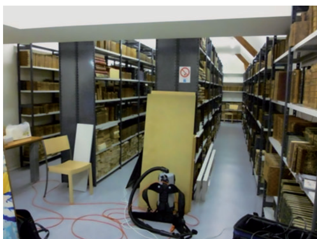
▼ Figure 3. Magasin 1 de la médiathèque de Château-Thierry, et schéma des points de prélèvement à 1,5 m (A, B, C), au plafond (B, C) et au sol (C) dans le magasin.

À l'issue du programme de recherche DECAGRAPH, une liste de COV m cibles spécifiques d'une contamination fongique des collections papier a pu être établie, et un indice de contamination spécifique, calculé. La présence effective d'une partie de ces COV m cibles a été confirmée dans tous les magasins de conservation contaminés retenus pour ce projet. Combinée à l'utilisation de l'ICF, la détection de ces COV m cibles pourra dorénavant être utilisée pour mettre en place une stratégie de surveillance de l'état sanitaire des collections de bibliothèques et d'archives en particulier. Dans cette optique, un prototype de capteur autonome adapté aux lieux d'habitation a d'ores et déjà été développé pendant toute la durée du projet DECAGRAPH dans le cadre d'une thèse, soutenue par Y. Joblin en septembre 2011 [5]. Une amélioration et une miniaturisation du prototype sont à l'étude et nous espérons une commercialisation pour les années à venir. On retiendra que parmi les COV m émis par les moisissures cellulolytiques sélectionnées