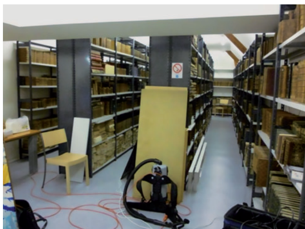
▼ Figure 3. Magasin 1 de la médiathèque de Château-Thierry, et schéma des points de prélèvement à 1,5 m (A, B, C), au plafond (B, C) et au sol (C) dans le magasin.

À l'issue du programme de recherche DECAGRAPH, une liste de COVm cibles spécifiques d'une contamination fongique des collections papier a pu être établie, et un indice de contamination spécifique, calculé. La présence effective d'une partie de ces COVm cibles a été confirmée dans tous les magasins de conservation contaminés retenus pour ce projet. Combinée à l'utilisation de l'ICF, la détection de ces COVm cibles pourra dorénavant être utilisée pour mettre en place une stratégie de surveillance de l'état sanitaire des collections de bibliothèques et d'archives en particulier. Dans cette optique, un prototype de capteur autonome adapté aux lieux d'habitation a d'ores et déjà été développé pendant toute la durée du projet DECAGRAPH dans le cadre d'une thèse, soutenue par Y. Joblin en septembre 2011 [5]. Une amélioration et une miniaturisation du prototype sont à l'étude et nous espérons une commercialisation pour les années à venir. On retiendra que parmi les COVm émis par les moisissures cellulolytiques sélectionnées