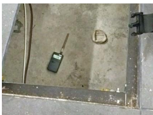
Figure 8, Détection de contaminations fongiques cachées dans une salle d'exposition d'un musée, nécessitant un second nettoyage.

Photographies et document : Stéphane Moularat / © CSTB.