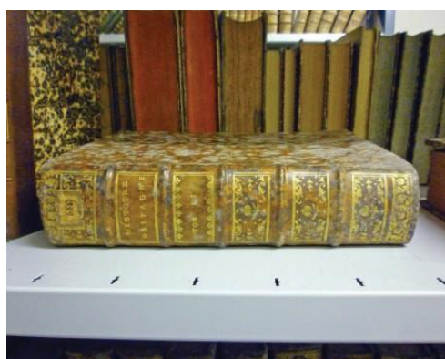
Figures 2 et 3, Cas d'un livre contaminé, retrouvé dans un magasin d'archives

En pratique, cette mesure consiste à réaliser un prélèvement gazeux d'une heure, à l'aide d'une pompe fonctionnant à 150 mL/min. Les échantillons sont ensuite acheminés au laboratoire pour analyse et calcul de l'ICF. Ainsi, il est possible, par une mesure simple, de diagnostiquer une croissance fongique dès le début du développement, y compris sans émission de spores dans l'air, ou encore d'assurer la surveillance d'un environnement vis-à-vis du risque de prolifération fongique.